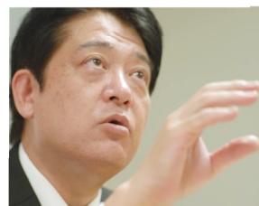
(株) テクノ経営総合研究所 副カンパニー長コンサルタント