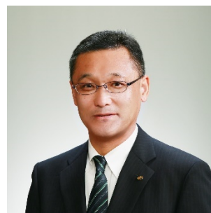
執行役員 コンサルタント 東日本カンパニー長